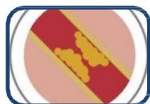
Què cal saber sobre la hipercolesterolèmia