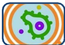
Què cal saber sobre els antibiòtics