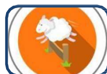
Què cal saber sobre l'insomni