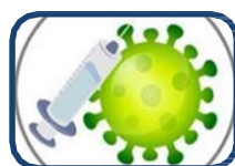
Què cal saber de les vacunes