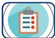
La importància de seguir bé els tractaments