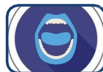
Què cal saber sobre la salut bucodental