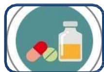
El bon ús dels medicaments