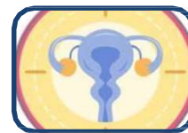
Què cal saber de la menopausa